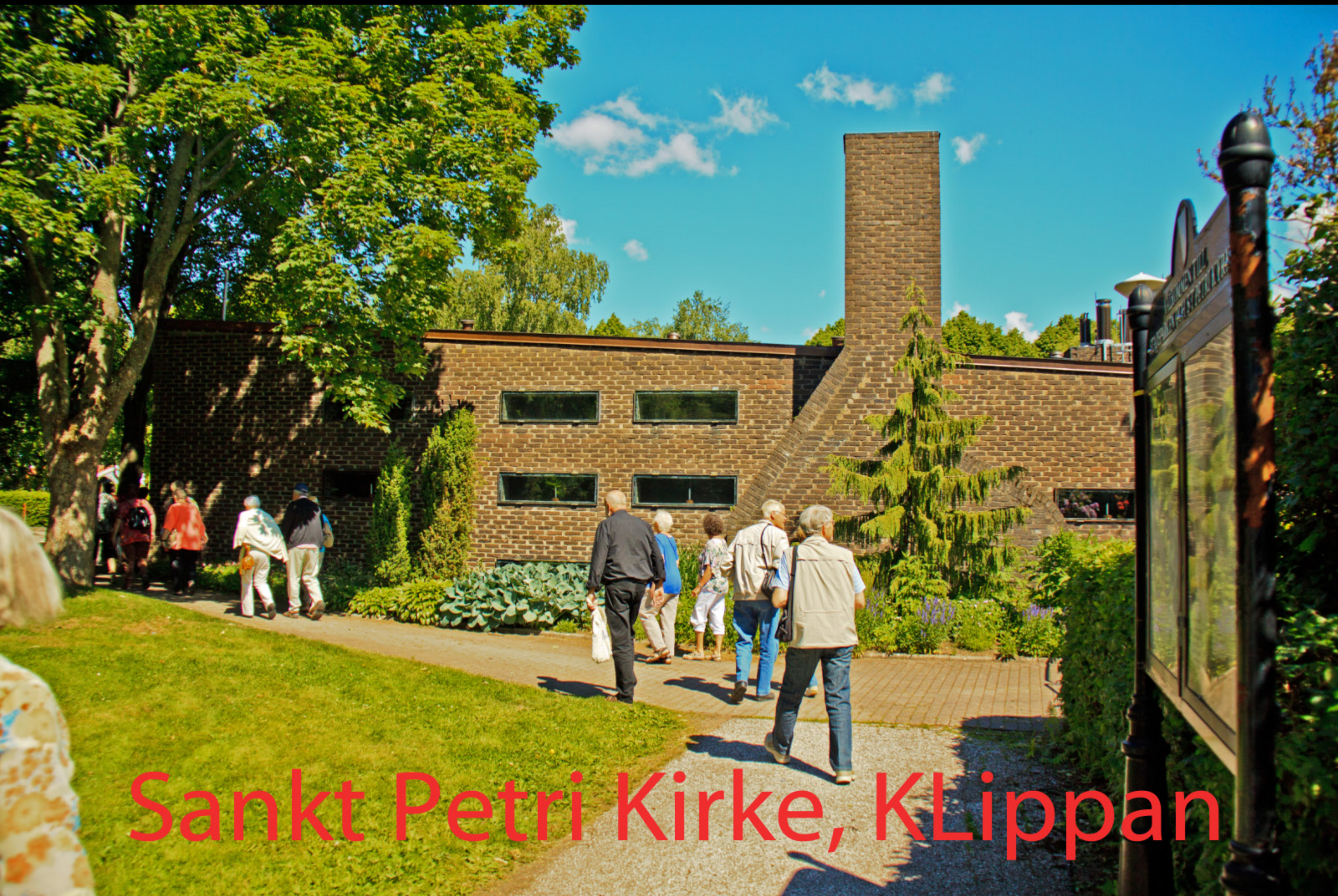
Sankt Petri Kirke, Klippan